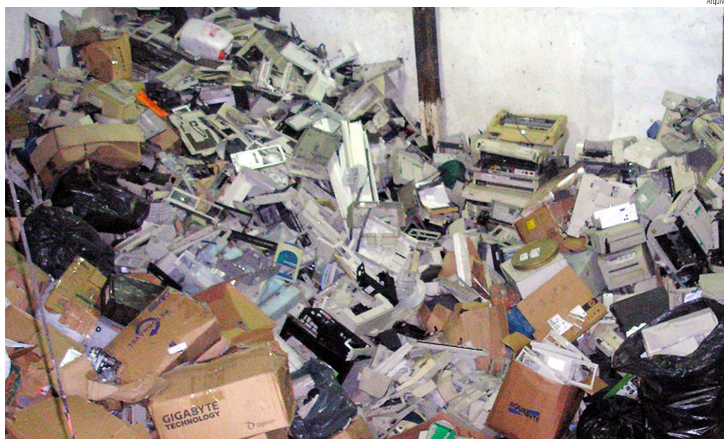
LIXEIRA Acúmulo de aparelhos eletrônicos; o Brasil é o mercado emergente que gera o maior volume de lixo eletrônico per capita a cada ano. O alerta é da Organização das Nações Unidas (ONU) que lançou ontem seu primeiro relatório sobre o tema e advertiu o Brasil sobre estratégia

Informações sobre lixo eletrônico são escassas e não há uma avaliação completa do governo federal sobre o problema. A ONU ainda indica que falta uma estratégia nacional para lidar com o fenômeno e que a reciclagem existente hoje não é feita de forma sustentável. As Nações Unidas ainda indicam que o problema não parece ser uma prioridade para a indústria nacional e que a ideia de um novo imposto não é bem-vinda diante da carga tributária no país.